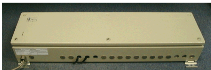
Module principal DOMS type PSS 2000