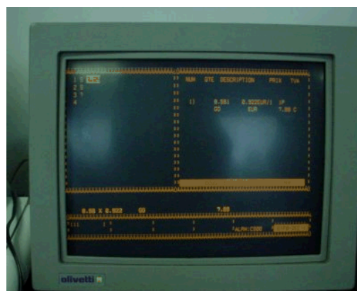
Ecran de visualisation des données mémorisées temporairement