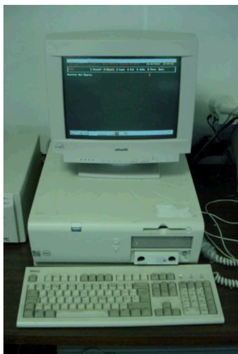
Module FOS (Front Office System)