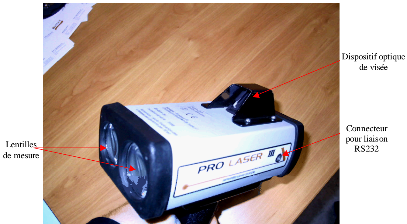
Vue du dessus avant gauche