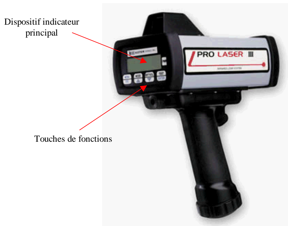
Vue latérale droite