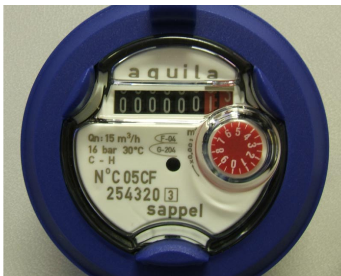
Totalisateur « V3 »