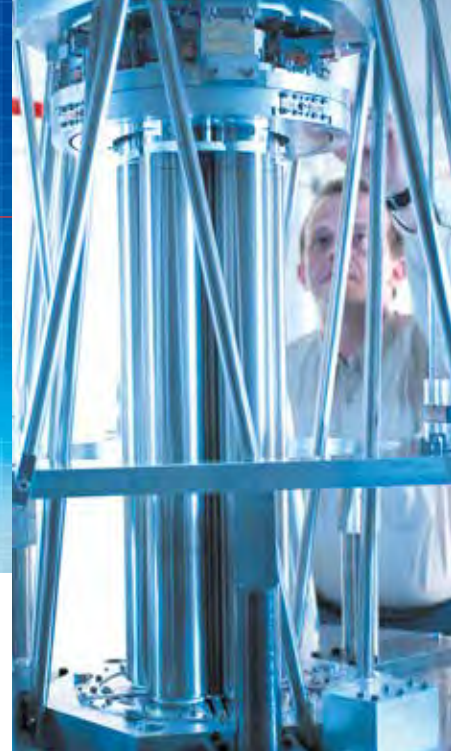
Nouvel étalon calculable de capacité électrique de Thompson-Lampard.

80 % du commerce mondial de marchandises est concerné par les essais et mesures qui attestent du respect des réglementations et des normes. Dans ce contexte, nous veillons à assurer le transfert de nos connaissances vers les industriels, via notre implication dans de nombreux pôles de compétitivité (aéronautique, matériaux composites, nutrition, économie numérique, etc.) et au sein d'une dizaine de réseaux et Groupements d'intérêt scientifique. Nous mettons nos bases de données à leur disposition, notamment dans le domaine du contact alimentaire et de la sécurité incendie. La caractérisation des matériaux étant par ailleurs essentielle pour les industriels, nous développons des plateformes dédiées réunissant tous les métiers associés telles que CARMEN, pour la caractérisation des nanomatériaux, et MATIS, pour la caractérisation thermique et optique des matériaux.