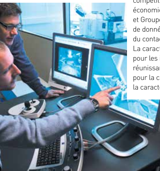
Métrologie des nano-objets : utilisation du microscope électronique à balayage de la plateforme CARMEN.

105 publications dans des revues à comité de lecture.